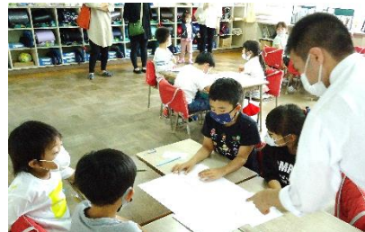
考えを練り合う（2年生）

1年生。 マスクをして迎えた入学式。ドキドキして始まった学校にもすっかり慣れて、たくさん字が書けるようになりました。 にこにこ挨拶をする笑顔がたくさん見られ友達をたくさん作った1学期でした。