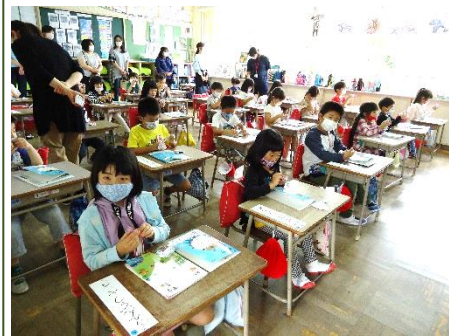
初めての学習参観（1年生・算数） 長さを比べる学習をしました。